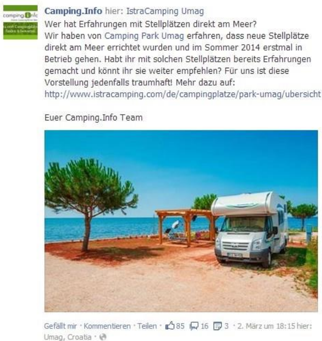
Beispiel für ein Facebook-Posting

Zeitgleich mit dem Posting auf Facebook wird dieses auch auf der Google+ Seite von Camping.Info veröffentlicht ( https://plus.google.com/+campinginfo/posts ). Das Posting wird ebenfalls mit einem Link direkt auf Ihre Homepage versehen.